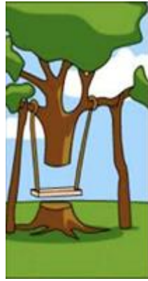
系統分析師所設計的