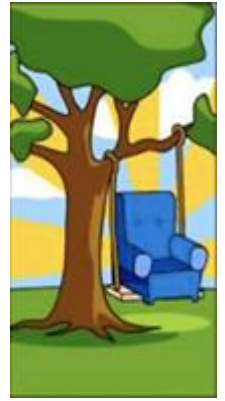
顧問所描繪的願景