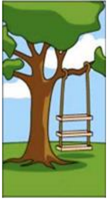
客戶解釋他們想要的

30. (a)解釋何謂「系統分析(System Analysis)」？(b)試就系統分析與設計，請說明下圖所想表達的意涵。(本題 10 分)