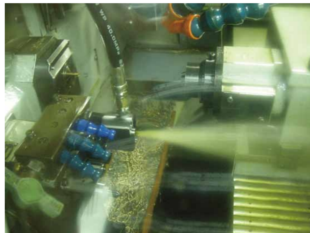
新式切削油供給套筒實際供油情況