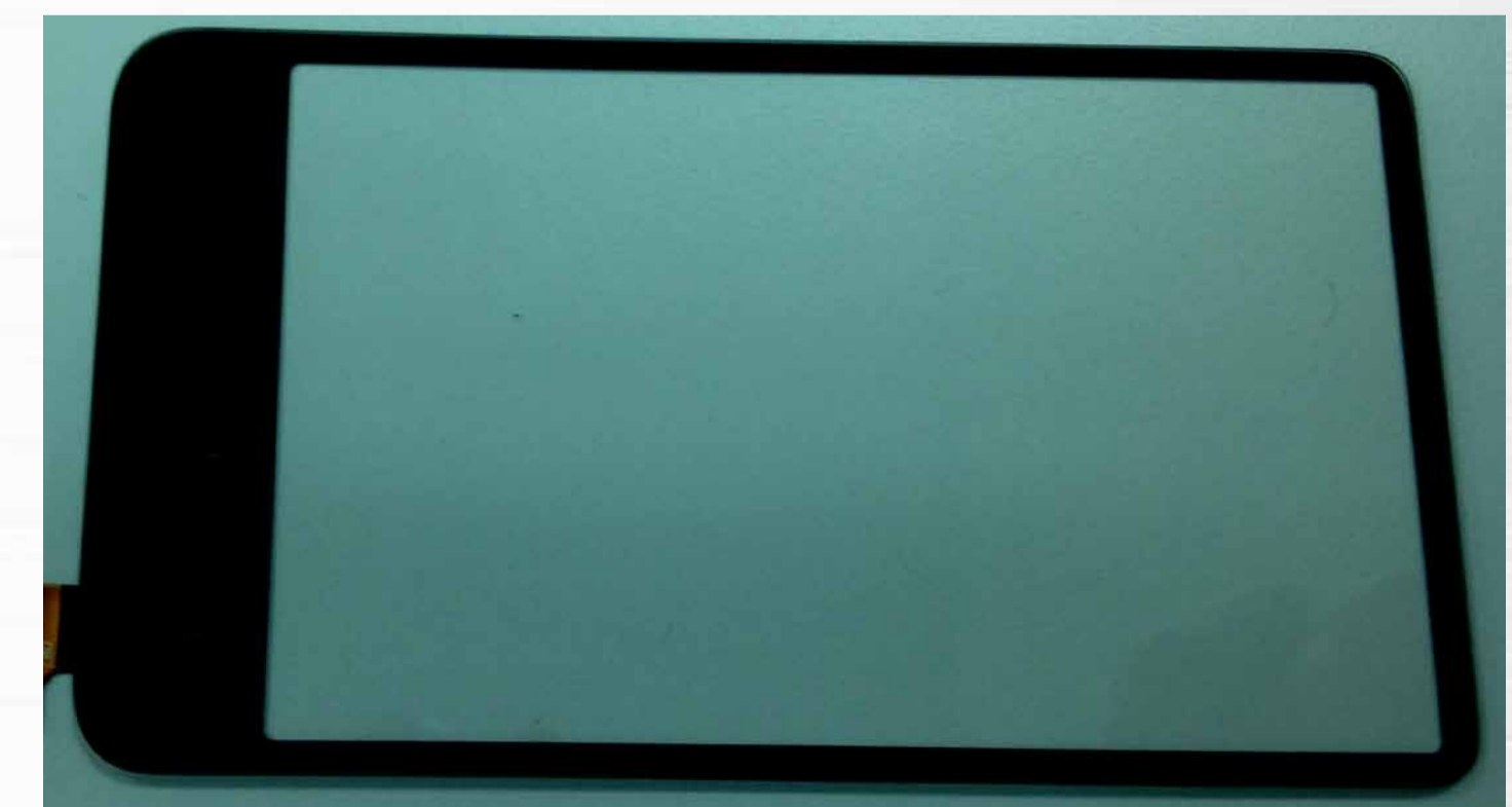
(圖 3) 觸控面板實體