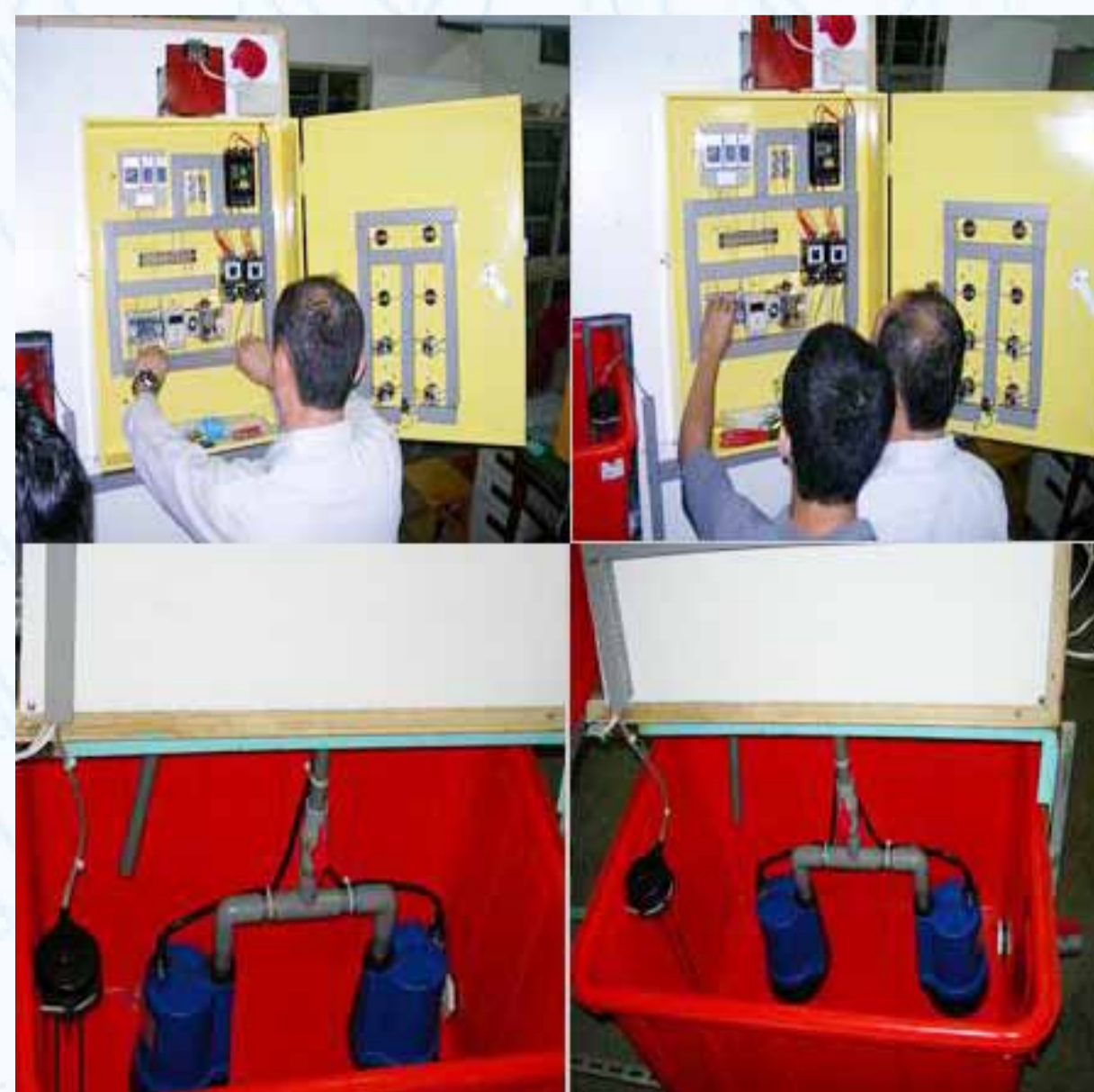
(圖 3) 不缺水馬達自動補水系統成品測試