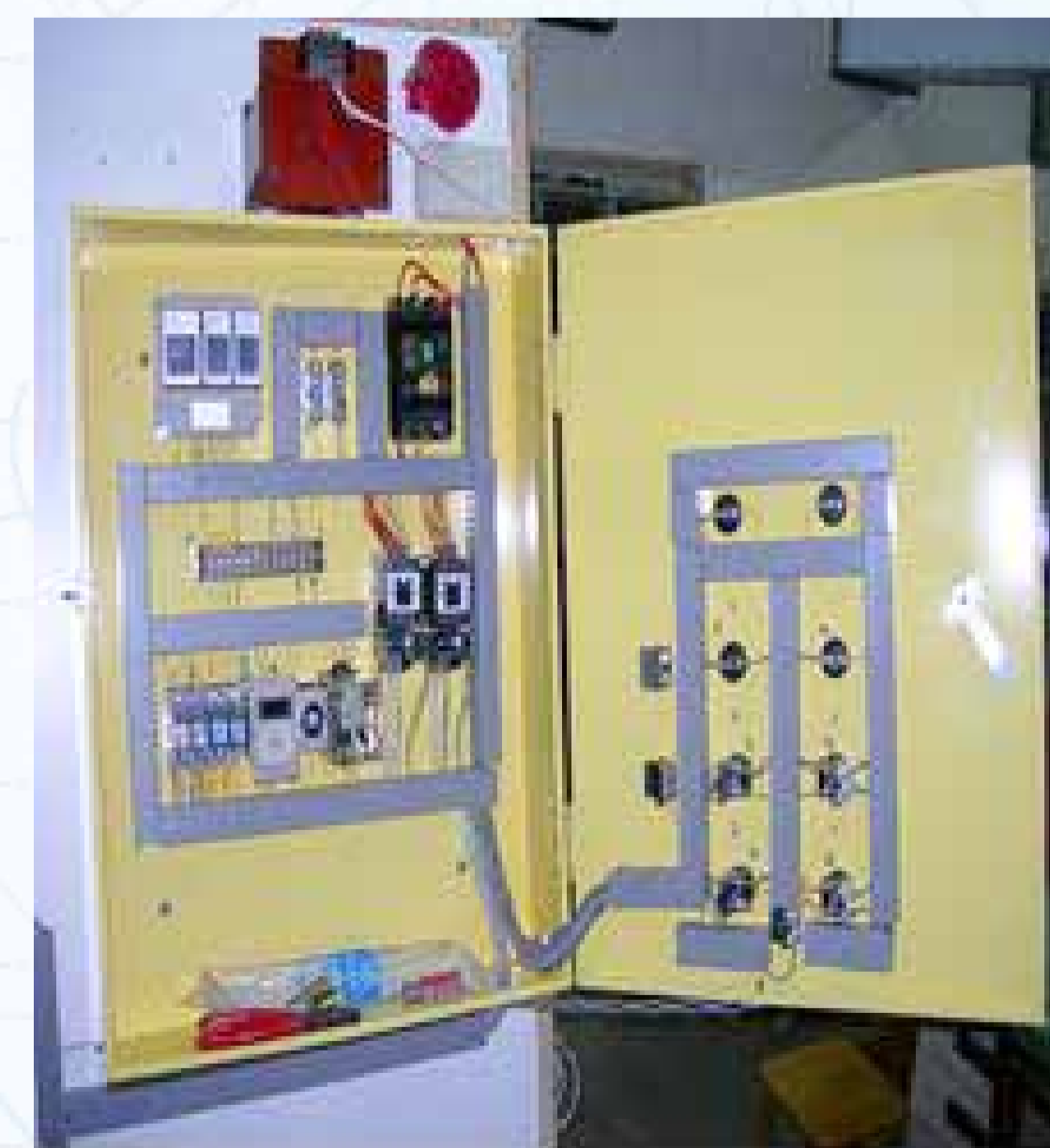
(圖 4) 本研究之不缺水馬達自動補水系統實際跑水測試後，抽水馬達自動交替運轉功能正常，計數器、計時器、警報系統皆正常運行，本次運用電壓由 110V 增壓至 220V