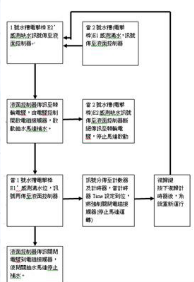
(圖 1) 不缺水馬達自動補水系統流程圖

教授專長： 能源科技、熱質對流、鑄造工程、焊接工程、無刷馬達、數值控制 CNC 加工