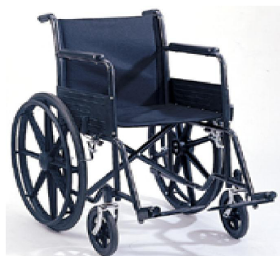
圖1 一般傳統輪椅結構

一般傳統輪椅外觀如圖1所示，輪椅的形狀像椅子，有兩個大輪子及兩個手握推力輪，剎車機構加在後輪，前輪較小用來轉向，一般輪椅比較輕便，可以摺疊收起，其他尚有特製輪椅、電動輪椅、特殊用輪椅、代步車等。但在操控方面均隱藏諸多缺點，因此松德興業公司，為了改善上述缺點，主動提議研製「坡道專用易操控輪椅電動助力器研製」的構想與本校進行產學合作。