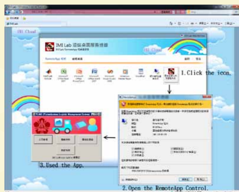
(圖 2) 透過 Web Browser 使用虛擬化服務